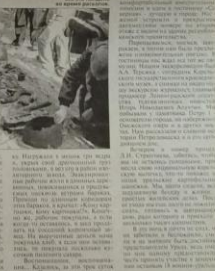
Солдаты в окопах.