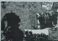
Я был самым младшим в семье, отец любил меня больше всех, а ушел на второй день начала войны. Как рассказывал...