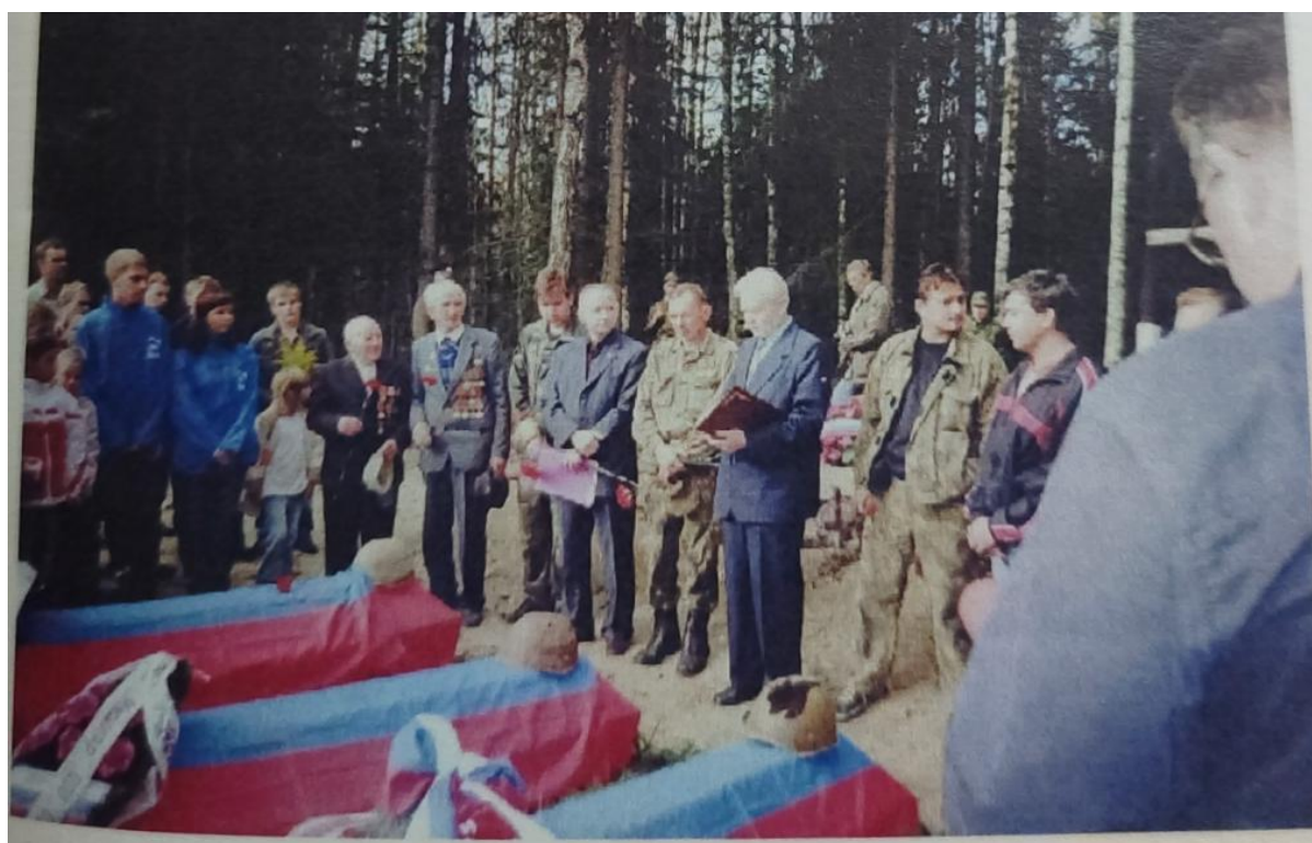
28 сентября 2007 г., участие в захоронении в братской могиле останков восемнадцати безвестно павших войнов-уральцев, среди которых был и его отец.