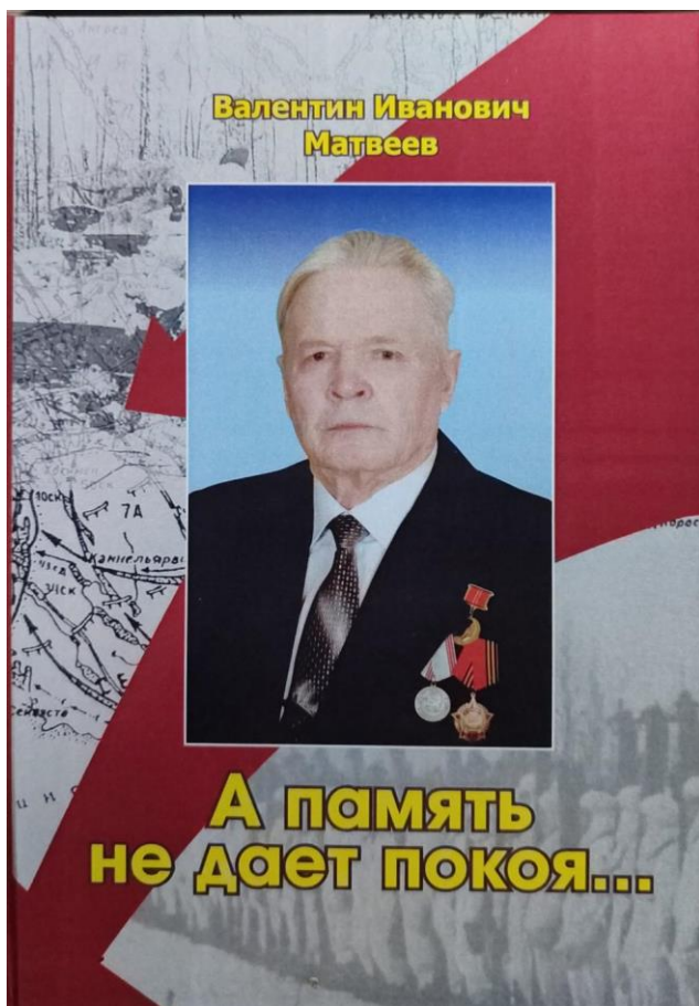
Книга «А память не даёт покоя ...», 2011 год