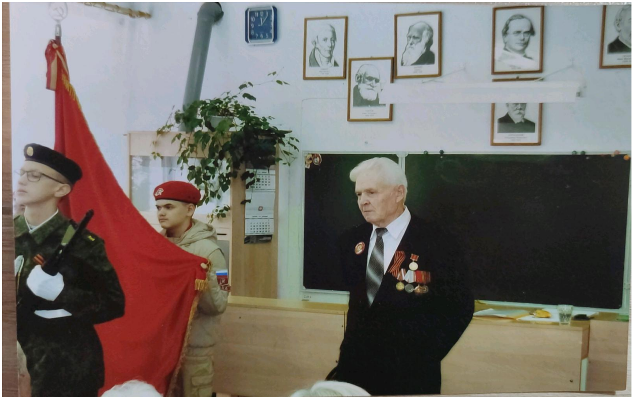
Проведение Уроков мужества