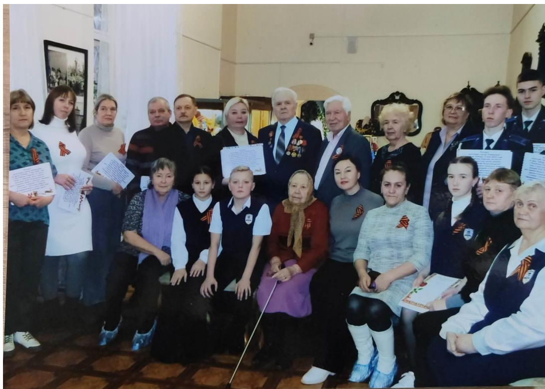
Встреча родственников воинов-уральцев 313-ой стрелковой дивизии